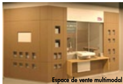
Espace de vente multimodal

Parallèlement, à l'extérieur, un distributeur de billets régionaux sera mis en place afin de faciliter l'achat de billets hors des horaires