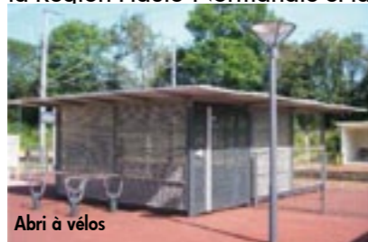
Abri à vélos

Ces travaux, d'un montant de 450 000 euros, sont financés par la Région Haute-Normandie et la