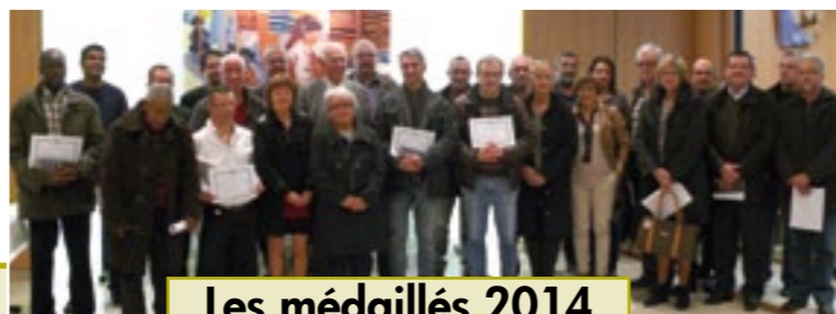
Les médaillés 2014

Avant de remettre à chacun sa médaille, le maire a félicité employés et chefs d'entreprises. "Je veux dire à chacun et à chacune d'entre vous que vous pouvez être fiers de vous et de ce que vous faites, c'est votre matière grise, ce sont vos bras qui possèdent de véritables richesses. Et à vous, représentants des entreprises qui nous font l'honneur d'être avec nous ce soir je tiens à vous dire la chance d'avoir des collaborateurs de qualité, qui font bénéficier le monde économique de leurs compétences et de leur savoir-faire."