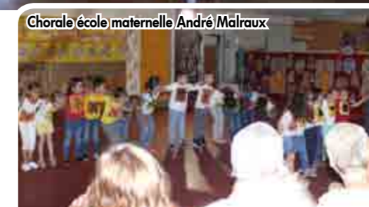
Chorale école maternelle André Malraux