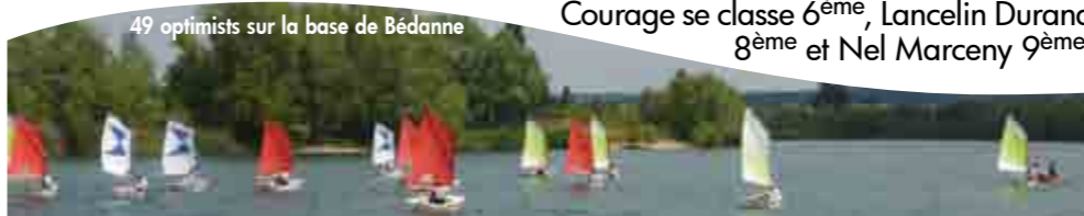
49 optimists sur la base de Bédanne