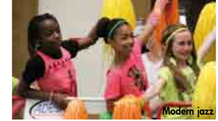
Démonstrations de danse par l'ADESA à l'occasion des festivités de la Pentecôte

Et bien sûr, retrouvez toutes vos associations et clubs "loisirs / culture" : anglais, art floral, ateliers créatifs, couture, reliure,