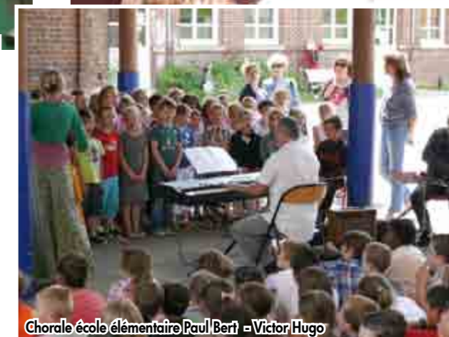
Chorale école élémentaire Paul Bert - Victor Hugo