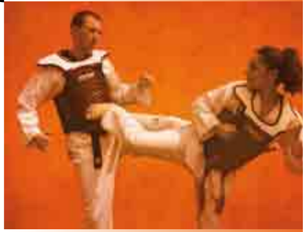
Horangi Kwan (l'école du tigre en coréen) dispense des cours de taekwondo*. Cette discipline, originaire de Corée du Sud, est à la fois un art martial, un sport de combat et une discipline olympique. Les entraînements auront lieu le mardi et le jeudi à la salle Taverna. Les enfants seront acceptés à partir de 6 ans. *Taekwondo signifie "la voie du pied et du poing".