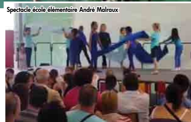
Spectacle école élémentaire André Malraux