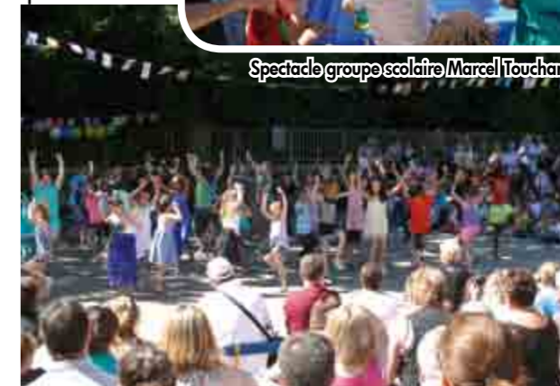
Spectacle groupe scolaire Marcel Touchard