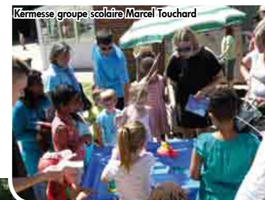
Kermesse groupe scolaire Marcel Touchard

Les élèves des écoles maternelles et élémentaires de la commune, accompagnés de leurs familles, ont participé aux chorales, remises de prix, spectacles, kermesses et autres animations proposées par les équipes enseignantes. Retour en photos sur quelques unes des animations proposées dans les écoles.