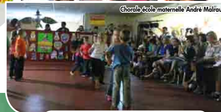
Chorale école maternelle André Malraux