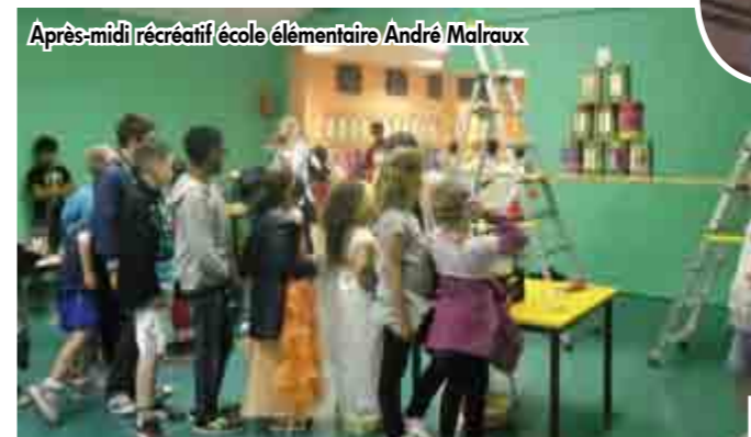
Après-midi récréatif école élémentaire André Malraux