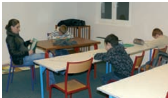
Les enfants se sont appropriés les locaux situés à l'étage du 15 rue Gantois. Les associations tiendront désormais leurs réunions dans les locaux libérés du 25 rue de la République.

Le site du quartier des Novalles souffrant du même problème d'exiguïté, les vacances de février seront mises à profit pour faire quelques travaux dans le bâtiment de l'ancienne mairie annexe, situé à côté de l'enseigne "Carrefour Market", qui accueillera