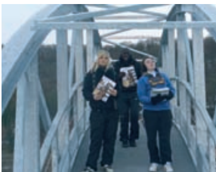
Depuis 2005, ce sont les jeunes de l'ALS qui distribuent l'ActuaCité dans vos boîtes aux lettres.

Dock laser, bowling, festival du jeu "Les Ludiques" à Notre Dame de Gravenchon, karting, cinéma, patinoire... : les sorties n'ont pas manqué pour les jeunes de l'ALS lors des vacances de fin d'année !