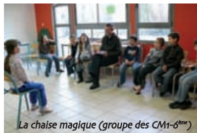
La chaise magique (groupe des CM1-6 ème )

Ces séances de théâtre se déroulent dans les locaux du centre de loisirs "L'Escapade". Cela représente deux avantages majeurs : les enfants passant leur mercredi à l'Escapade ont