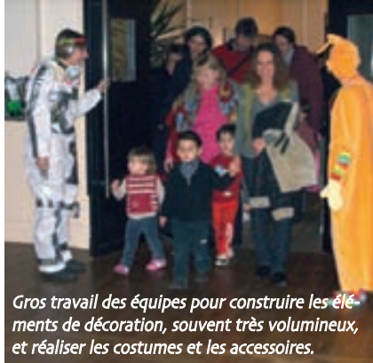
Gros travail des équipes pour construire les éléments de décoration, souvent très volumineux, et réaliser les costumes et les accessoires.

Les haltes-garderies municipales proposaient cette année aux enfants un voyage à destination de la Lune à l'occasion du spectacle de Noël.