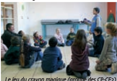
Le jeu du crayon magique (groupe des CP-CE2)

Parmi les nombreuses activités proposées par la ville aux enfants des écoles, figure le théâtre.