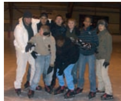
Activités et sorties au programme pour la trentaine de jeunes fréquentant chaque jour l'ALS.