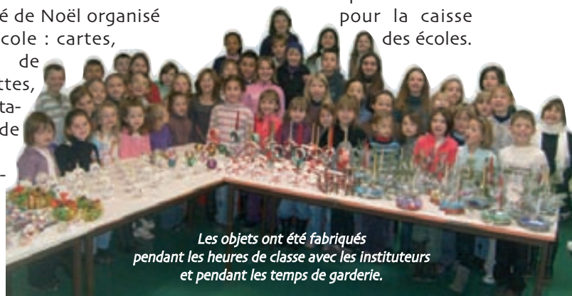
Les objets ont été fabriqués pendant les heures de classe avec les instituteurs et pendant les temps de garderie.