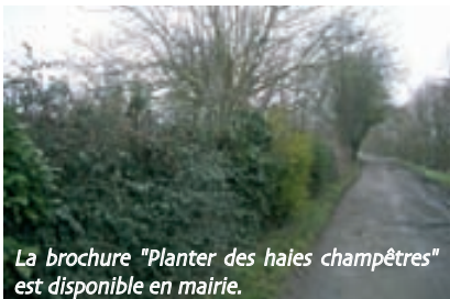
La brochure "Planter des haies champêtres" est disponible en mairie.

Enfin, plus il y a de végétaux différents et plus la faune a de chances d'être riche !