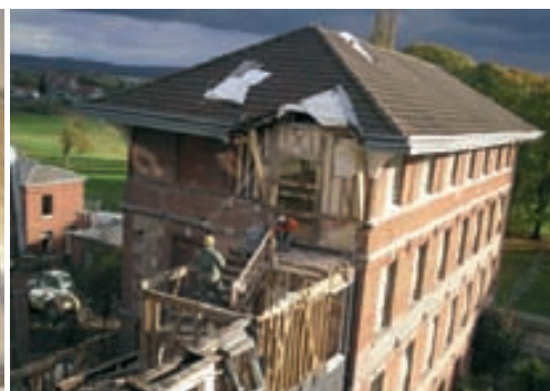
L'opération "Les Catalpas" menée par la SA HLM d'Elbeuf est une rénovation lourde. Seule la "coque" sera préservée. La restructuration de l'intérieur a débuté en novembre 2009. La livraison des logements est prévue en fin d'année 2010.