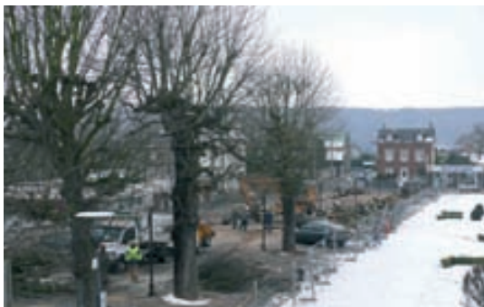
Quinze jours ont suffi à l'entreprise Saint-Martin pour abattre les 51 marronniers que comptait l'esplanade, assurer le dessouchage, le débitage et l'enlèvement du bois. La société MBTP a ensuite effectué une réfection provisoire des aires de stationnement, en attendant le réaménagement.

Les services municipaux, avec l'appui d'un cabinet paysagiste, étudient des propositions de réaménagement de l'esplanade en préservant l'éclaircissement, en valorisant les façades et en optimisant