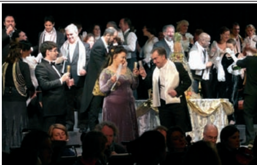
Temps fort de cet opéra, les tableaux réunissant tous les chanteurs sur scène. L'orchestre composé des 50 musiciens est, lui, positionné en contrebas.

Les 80 musiciens de l'orchestre JSB ont clôturé le festival avec deux concerts du Nouvel an particulièrement appréciés du public.