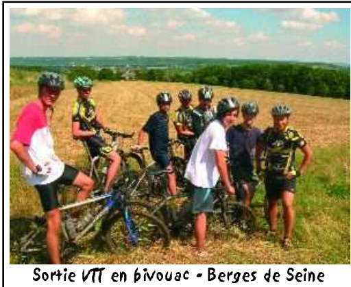
Sortie VTT en bivouac - Berges de Seine

L'été fut riche en activités pour la trentaine de jeunes inscrits chaque jour à l'ALS :