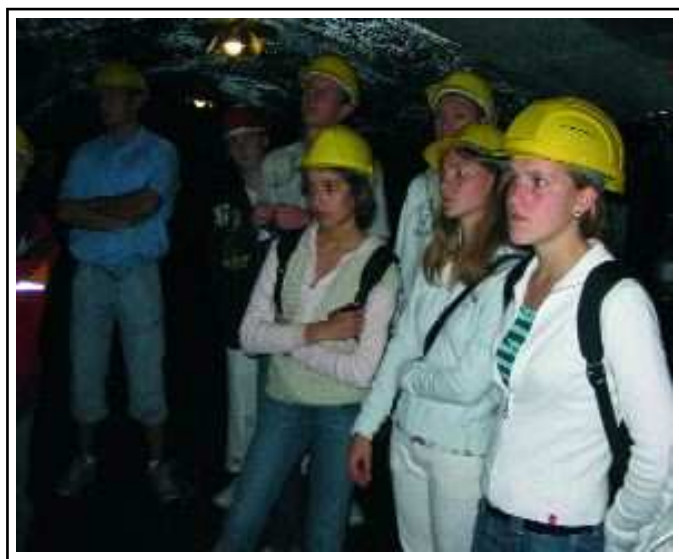
Visite de la mine de Rammelsberg. Cette mine, dont l'exploitation a été arrêtée en 1988 suite à l'épuisement de son gisement métallifère, est classée au patrimoine de l'UNESCO. Equipés du casque réglementaire, les jeunes sont descendus pour un voyage insolite à bord des wagons d'origine du train minier et ont découvert, au cours d'une visite commentée, les installations et le travail dans les mines au début du siècle.

Une quarantaine de jeunes de Saint-Aubin et de Pattensen participaient au camp franco-allemand organisé cette année en Allemagne, à Wernigerode (Saxe), du 27 juillet au 12 août. De nombreuses activités et visites étaient au programme de ce séjour : visite du château de Wernigerode, de la mine de Rammelsberg, d'un musée d'aviation, mais également des activités de loisirs : piscine, canotage, parc d'attraction.... Les adolescents français et allemands, âgés de 14 à 17 ans, étaient hébergés en auberge de jeunesse tout au long de ce séjour. ■