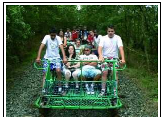
Sortie vélo-rail - Camp Longeville-sur-Mer

Le beau temps tout au long du séjour a permis aux jeunes de pratiquer de nombreuses activités : baignade, ballades à vélo, vélo-rail, parc aquatique, labyrinthe dans un champ de maïs, parc de jeux, pétanque, etc.