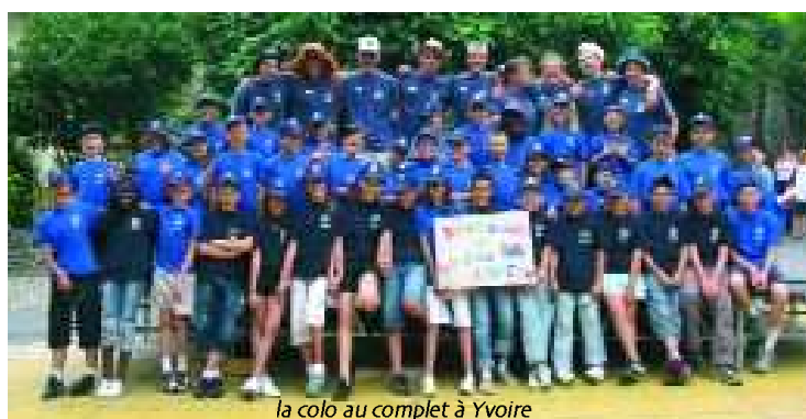
la colo au complet à Yvoire

40 enfants âgés de 6 à 12 ans, encadrés par une directrice et 8 moniteurs, sont partis à Saint-Paul en Chablais (Haute-Savoie) pour un séjour de trois semaines en centre d'hébergement du 6 au 27 juillet.