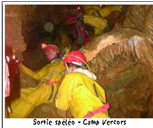
Sortie spéléo - Camp Vercors

Au programme de ce séjour : spéléo, canyoning, VTT, paint-ball, piscine... Les jeunes ont bénéficié d'un beau temps tout au long de ce séjour en camping.