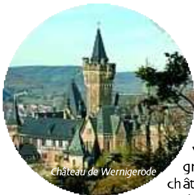
Château de Wernigerode

Une quarantaine de jeunes de Saint-Aubin et de Pattensen participaient au camp franco-allemand organisé cette année en Allemagne, à Wernigerode (Saxe), du 27 juillet au 12 août. De nombreuses activités et visites étaient au programme de ce séjour : visite du château de Wernigerode, de la mine de Rammelsberg, d'un musée d'aviation, mais également des activités de loisirs : piscine, canotage, parc d'attraction.... Les adolescents français et allemands, âgés de 14 à 17 ans, étaient hébergés en auberge de jeunesse tout au long de ce séjour. ■