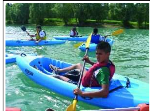
Kayak à Bedanne