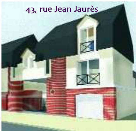
43, rue Jean Jaurès

Permis de la SA HLM d'Elbeuf en cours d'instruction pour la réalisation de 4 logements.