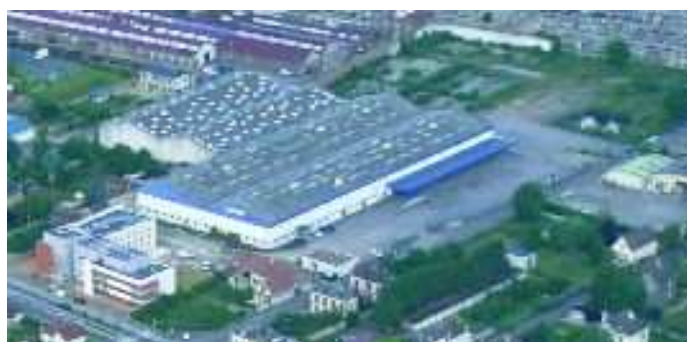
Angle rues de la Marne / Mal Leclerc (ex. site ABX)

Les premiers schémas d'aménagement sont dressés. Ce site permettra d'une part la réalisation de logements collectifs et individuels (environ 170), et d'autre part, d'une zone d'activité économique pour des activités tertiaires non bruyantes et non polluantes. Une réalisation envisagée dans un proche avenir.