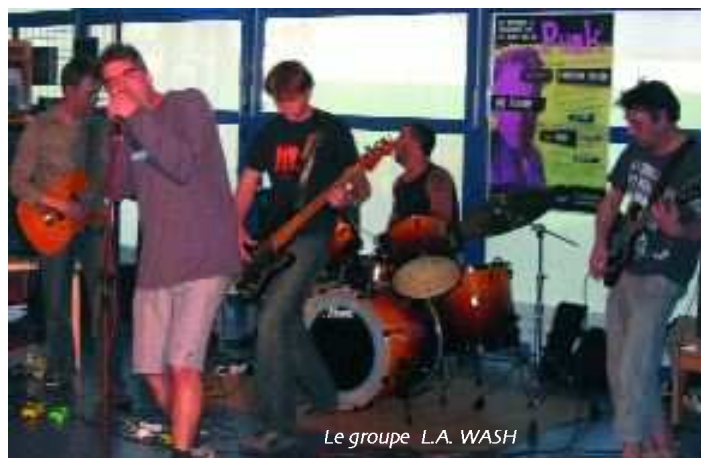
Le groupe L.A. WASH

Le 22 septembre, lors de la journée spéciale "Punk", l'Odyssée recevait Christian Victor, critique rock pour Juke Box Magazine. Le journaliste a très justement retracé, à la lumière d'éléments socio-culturels, l'histoire d'un mouvement musical essentiel, à la fois créatif et sulfureux. La journée s'est terminée par un