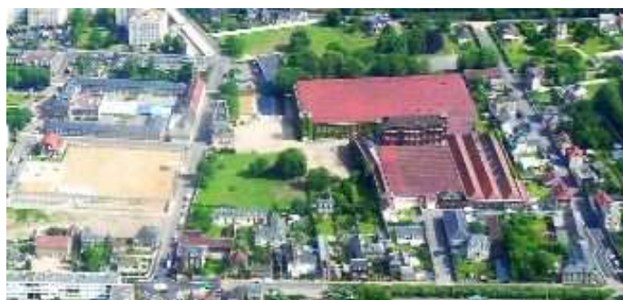
Rue André Gantois (ex. établissement Diffusion n°1)

Les différentes études préliminaires et le schéma général de reconversion de cette ancienne friche industrielle sont aujourd'hui achevés. Les orientations retenues feront l'objet d'un phasage pour une réalisation s'étendant jusqu'en 2012. Equipements publics (dont une école maternelle, une salle polyvalente, l'école de musique et de danse de l'agglomération) et logements (80 à 100 en collectif) cohabiteront à terme sur ce site.