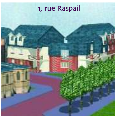
1, rue Raspail

Permis délivré à la SA HLM d'Elbeuf pour quatre logements qui sortiront de terre début 2008.