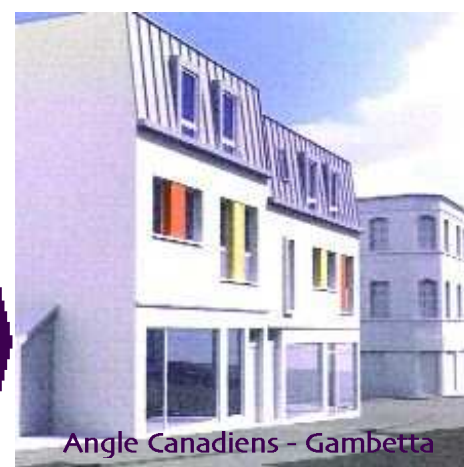
Angle Canadiens - Gambetta