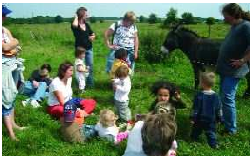
Les sorties sont des temps d'échanges forts au sein des garderies. Ainsi, le 19 juin 2007, 15 enfants accompagnés de leurs parents ont participé à la sortie de fin d'année à la ferme de la Bretterie à Carsix. Les tout-petits ont découvert les animaux de la ferme : vaches, lapins, poules, chèvres,... et les parents ont pu découvrir les secrets de la fabrication du cidre. Un goûter fermier a clôturé cet après-midi riche en découvertes.

Cette année, Les enfants de La Câlinerie évolueront au rythme de la Bretagne, de ses contes et légendes, de ses traditions et spécialités culinaires. Au "Jardin des Lutins", ce sont les fruits et légumes qui seront à l'honneur avec la réalisation d'un potager, des ateliers cuisine et la visite d'un jardin pédagogique. ■