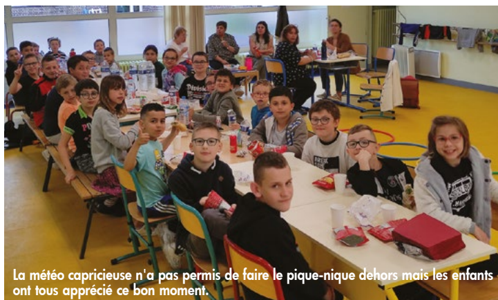
La météo capricieuse n'a pas permis de faire le pique-nique dehors mais les enfants ont tous apprécié ce bon moment.

Les élèves de Malaunay ont pris le train et sont arrivés à l'école Bert-Hugo en milieu de matinée. Ils ont pu rencontrer "en vrai" leurs correspondants et ont ensuite participé à un rallye-photo proposé dans l'enceinte de l'école : énigmes ou défis, tous les élèves se sont dépassés et ont découvert, voire redécouvert, l'école.