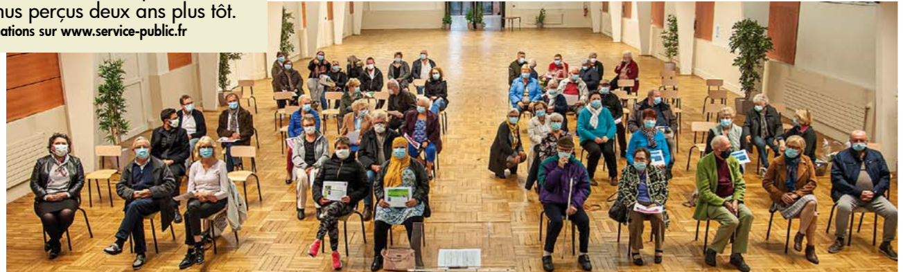
Les lauréats étaient reçus à la salle des fêtes où les consignes sanitaires ont pu être appliquées.

avons rejoint l'engagement de la Métropole dans la COP 21 pour le climat. Nous constatons que le réchauffement climatique est chaque année plus pesant, les températures de cet été en attestent, mettant à mal les fleurissements. Nous allons aujourd'hui plus loin dans la démarche avec notre engagement dans l'obtention d'un label "Cit'ergie", récompensant les collectivités pour la mise en œuvre d'une politique "climat - air - énergie" ambitieuse. Ce processus nous permettra à terme de réduire notre consommation et donc notre facture énergétique. Nous espérons que chacun d'entre vous, à son échelle, souhaitera se joindre aux actions menées en faveur de l'environnement. Pourquoi ne pas, par exemple, dès l'an prochain, repenser vos fleurissements avec des plantes moins gourmandes en eau, supportant plus la chaleur, en installant si possible des récupérateurs d'eau, en faisant votre compost, réduisant ainsi également vos déchets ménagers. C'est avec de petites actions quotidiennes que nous pourrions changer les choses."