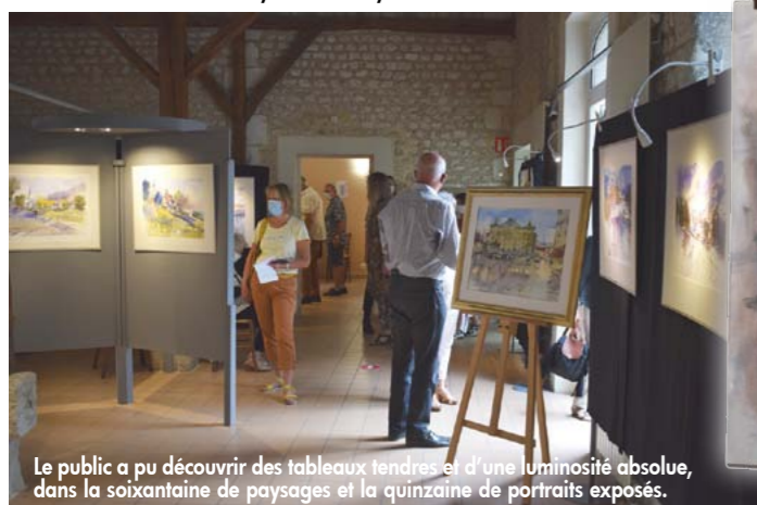
Le public a pu découvrir des tableaux tendres et d'une luminosité absolue, dans la soixantaine de paysages et la quinzaine de portraits exposés.