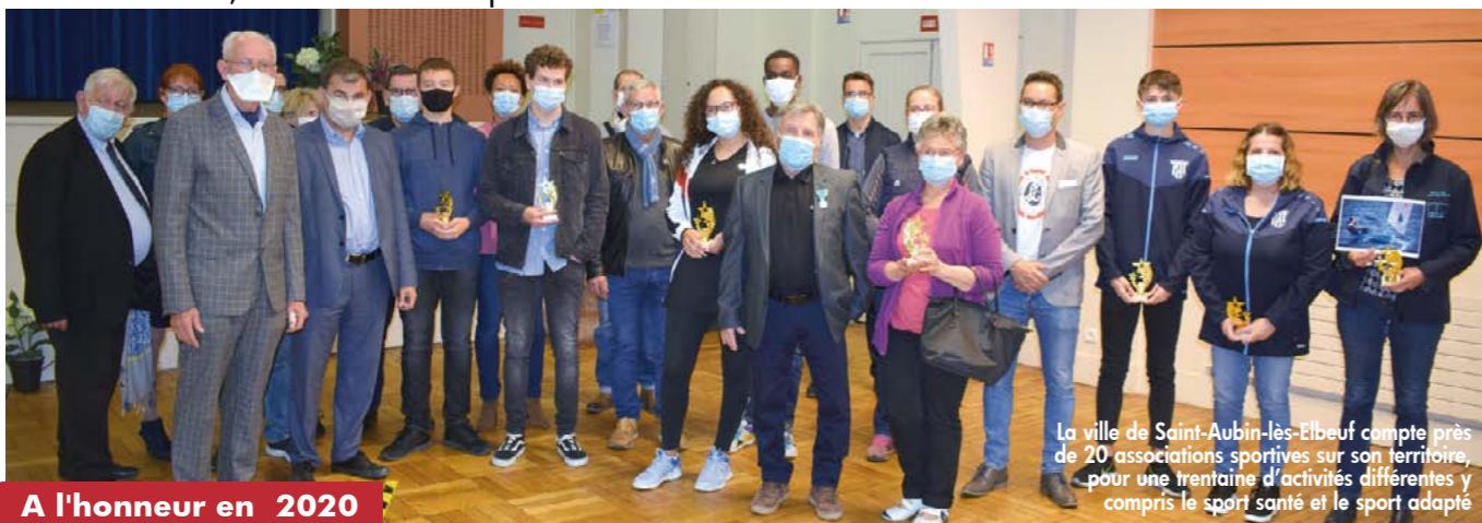
La ville de Saint-Aubin-lès-Elbeuf compte près de 20 associations sportives sur son territoire, pour une trentaine d'activités différentes y compris le sport santé et le sport adapté