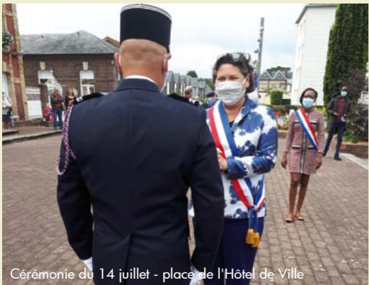
Cérémonie du 14 juillet - place de l'Hôtel de Ville

Les commémorations de la Fête Nationale et de la Libération de Saint-Aubin se sont déroulées dans le strict respect des consignes sanitaires.