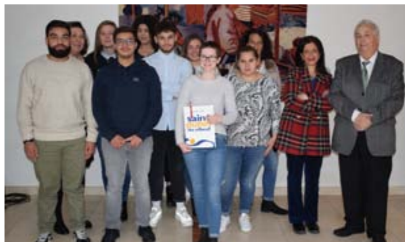
Les 17 "césarisés" ont de 18 à 24 ans, 8 filles, 9 garçons. Leurs lieux d'étude sont pour 9 d'entre-eux notre Métropole, 4 en Normandie hors Métropole, 4 hors Normandie (dont un en Russie). Ils ont tous fait leurs études secondaires dans notre agglomération, la grande majorité au collège Arthur Rimbaud de notre commune puis au lycée André Maurois et sont inscrits dans 13 cursus différents.

Dix-sept jeunes sont cette année bénéficiaires du CESA et trois dossiers sont en cours de traitement. Au total, 20 jeunes Saint-Aubinois profiteront de cette aide financière pouvant aller jusqu'à 1 500€.