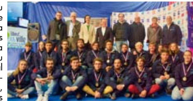
Les sportifs du CVSAE mis à l'honneur en présence des représentants des financeurs : Région, Département, Ville de Saint-Aubin-lès-Elbeuf

Au classement annuel au Championnat de France des clubs, le président a eu la fierté d'annoncer que le CVSAE, sur 800 clubs classés, se place 2 ème en habitable derrière l'APCC La Baule-