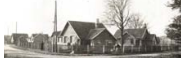
Les premières constructions du quartier des 99 maisons en 1928.

Dans le cadre de son label Villes et Pays d'art et d'histoire, la Métropole Rouen Normandie propose une exposition sur les "cités-jardins" à la Fabrique des savoirs du 15 juin au 21 octobre 2018. Sont également proposées des visites guidées sur tout le territoire, dont celle du quartier des 99 maisons le samedi 23 juin.