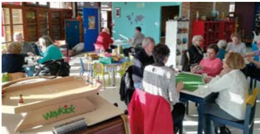
La ludothèque La Toupie propose plus de 1000 jeux de société pour jouer sur place ou à emprunter.

Alors, seul, entre amis ou en famille, profitez agréablement de votre temps libre en venant jouer à la ludothèque !