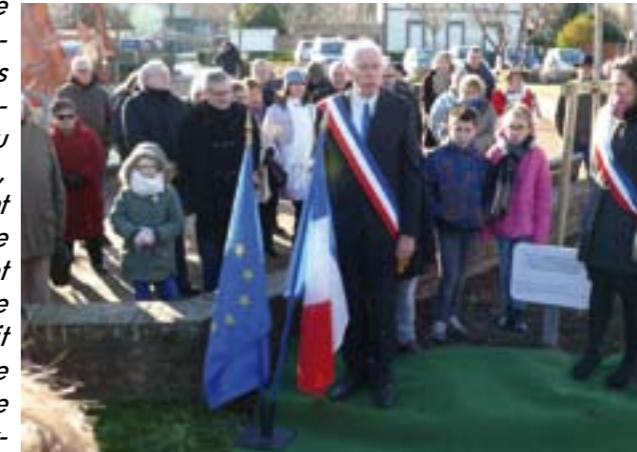
C'est un ginkgo biloba, faisant partie de la plus ancienne famille d'arbres connue, qui a été retenu comme symbole de la laïcité.

L'inauguration s'est achevée sur les notes de la Marseillaise, reprise par l'assistance.