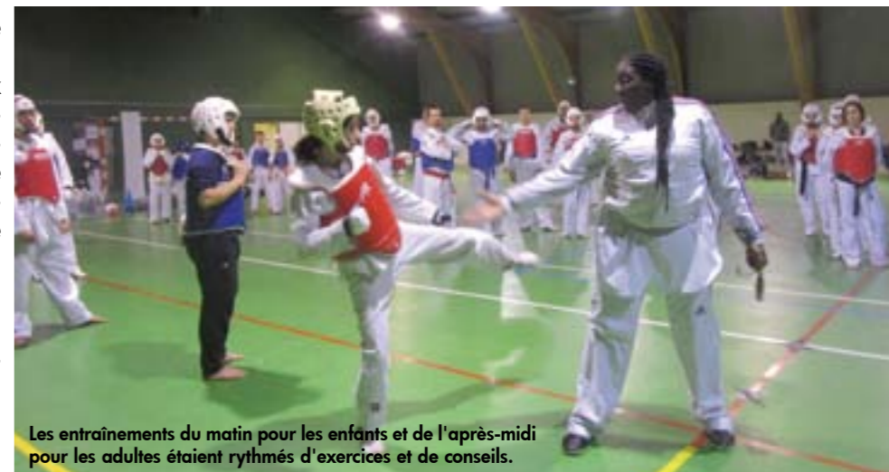
Les entraînements du matin pour les enfants et de l'après-midi pour les adultes étaient rythmés d'exercices et de conseils.

Un succès total sur cette journée qui a séduit les nombreux participants !