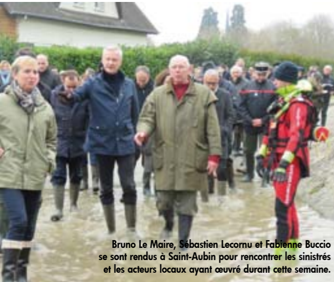
Bruno Le Maire, Sébastien Lecornu et Fabienne Buccio se sont rendus à Saint-Aubin pour rencontrer les sinistrés et les acteurs locaux ayant œuvré durant cette semaine.

les habitants et les services publics dans les prochaines semaines notamment le pompage de l'eau et le nettoyage des habitations, les problèmes éventuels sur le réseau d'assainissement (géré par la Métropole), l'évacuation des déchets et le nettoyage des zones sinistrées. Concernant les assurances, la déclaration de catastrophe naturelle a été demandée par le Maire auprès de la Préfecture le 31 janvier. Une demande réitérée lors de la visite de Bruno Le Maire, Ministre de l'Économie et des Finances, de Sébastien Lecornu, Secrétaire d'État à la Transition écologique et solidaire, et Fabienne Buccio, Préfète de la région Normandie, lors de leur déplacement à Saint-Aubin le 5 février au matin.