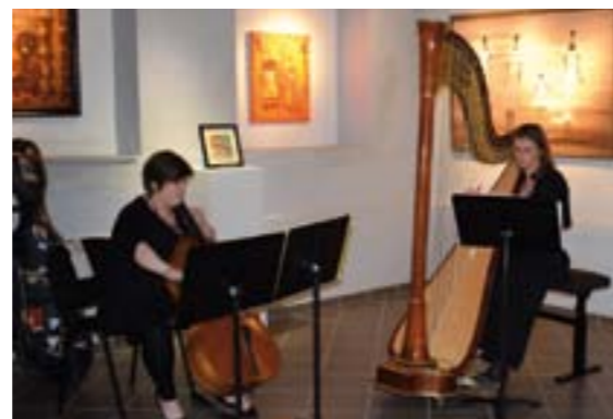
L'EMDAE accompagne le vernissage de l'exposition en musique.