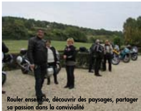
Rouler ensemble, découvrir des paysages, partager sa passion dans la convivialité